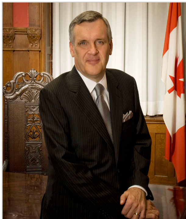
L'hon. David C. Onley, Lieutenant-gouverneur de l'Ontario